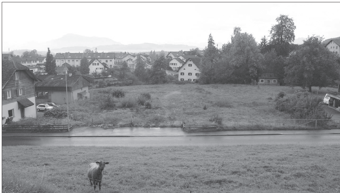
Für das Gebiet zwischen Dorfbach und Aarauerstrasse soll ein Gestaltungsplan erstellt werden.