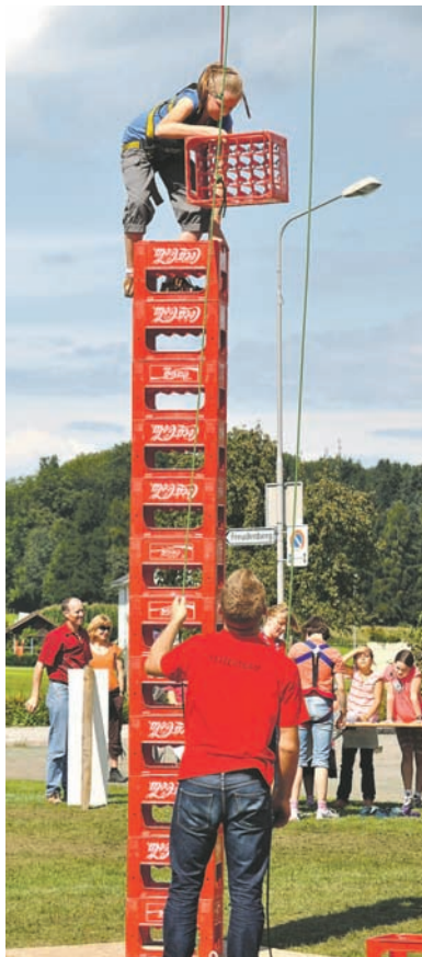
Das letztjährige Harrassenstapeln war ein voller Erfolg und wird auch dieses Jahr sicher wieder viele Mutige anlocken.