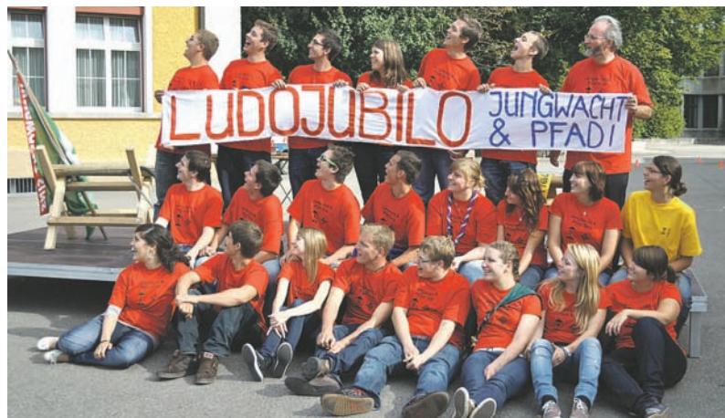
Pfadi, Jungwacht und Pfarrei Sins spannen bereits seit drei Jahren zusammen um einen Anlass für Jung und Alt zu organisieren, mit Erfolg!