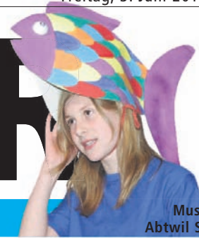
Musical in Abtwil Seite 7