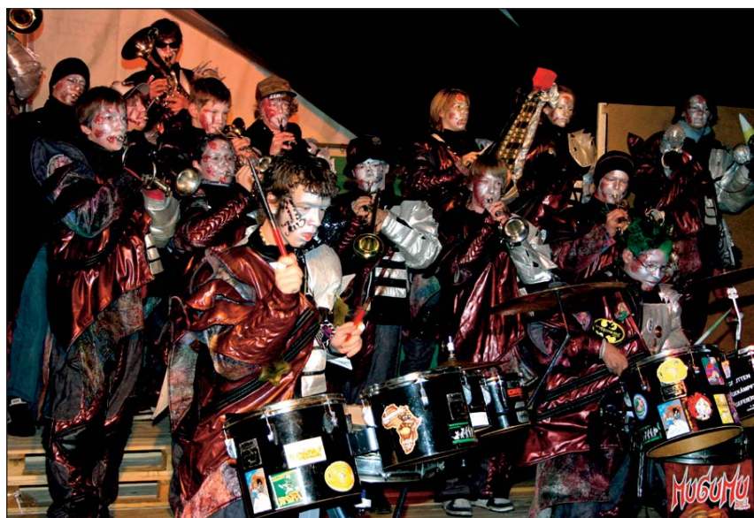
Die Rütifäger von Oberrüti sind mit Abstand die Jüngste Guggenmusik weit und breit.