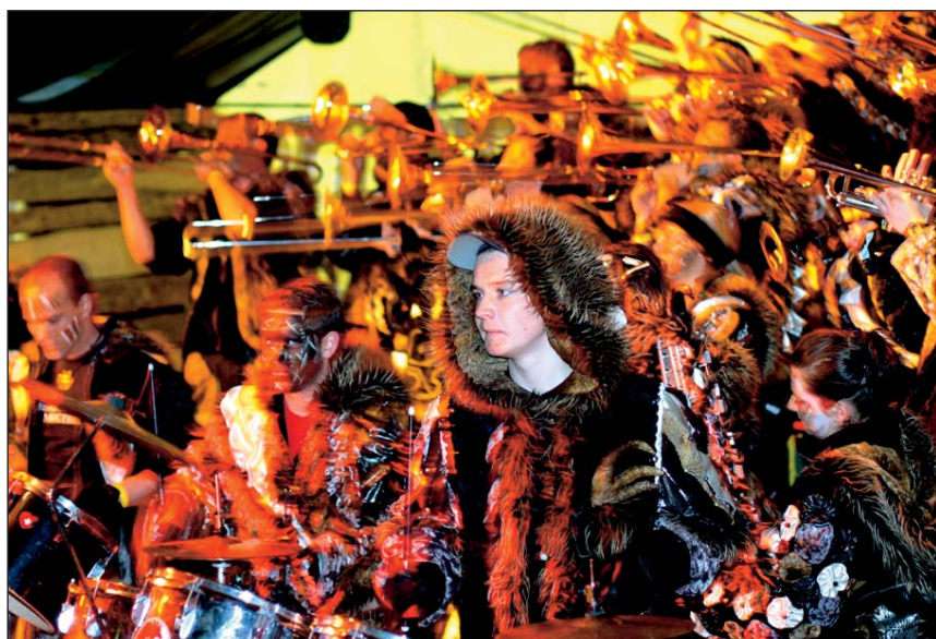
Die Rüsstalschränzer machten den Auftakt zur Sins'er Fasnacht.