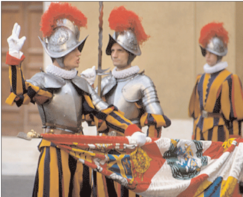
Junge Schweizer Gardisten bei der Vereidigung.

Das Fahmentuch hat ein Ausmass von 2,2 m x 2,2 m und besteht aus Seidenda-