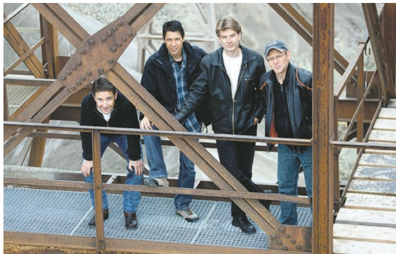
Die Band Reload4 sorgt am Samstagabend für Stimmung.

Die ehemaligen Alikoner werden dazu ganz herzlich eingeladen! 10.30 Brunnensegnung auf dem Dorfplatz. Musikalische Umrahmung Männerchor Sins und Schule Alikon 11.30 Apéro offeriert vom Gerechtigkeitsverein Alikon-Holderstock. Es spielt die Freudenberger Blaskapelle. Festwirtschaften ab 11.00 Uhr geöffnet. «Cüpli-Bar» als Treffpunkt. «Schmitte» mit feinen Grilladen und Beilagen. Ab 12.00 Uhr musikalische Unterhaltung mit dem «Trio Bügelspez» aus Baar. «Buurestube» urchige Menüs. Ab 12.00 Uhr spielt das Ländlertrio Chaschtetörli. «Gartenkaffee»: Kuchen und feine Kaffees. Buntes Treiben auf dem Dorfplatz und der Strasse. Glücksrad, Drehorgel, Ponyreiten. 16.30 Ziehung der Hauptgewinner Glücksrad.