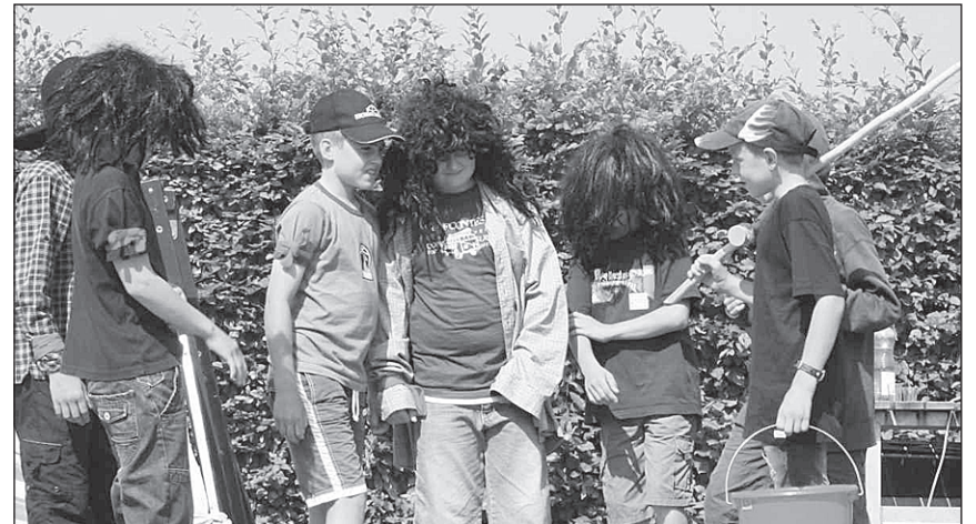
Die 4.- und 5.-Klässler spielten das Theater «Mordnacht in Luzern».