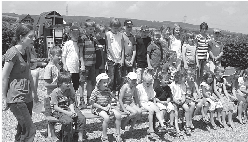
Die Gesamtschule Aettenschwil.

In der Schule Aettenschwil spürt man die Verbundenheit der Bevölkerung mit der Schule, dies auch im Zusammenhang mit dem im September stattfindenden Jubiläum, so der Schulleiter. Schulpflegepräsident Jakob Sidler bedankte sich ebenfalls bei den Lehrpersonen. Der Schulstandort Aettenschwil sei für die nächsten 10 bis 20 Jahre unbestritten. Es stünden deshalb bauliche Veränderungen an. Sie seien in Planung. Zuerst müsse aber die Raumnutzung überdacht werden, damit künftig ein attraktiver Arbeitsplatz und Schulstandort angeboten werden könne.