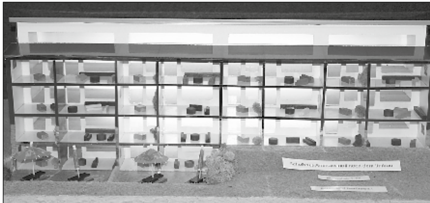
Der entworfene Anbau für das Schulhaus wurde im Modell nachgebaut.